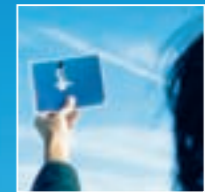
Umwelt und Gesundheit