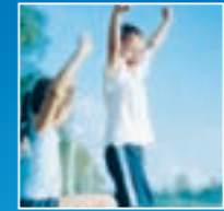
Kinder und Jugend

Wenn wir Handlungsbedarf erkennen, dann prüfen wir unsere Möglichkeiten der positiven Einflussnahme. Und wenn wir die Chance sehen, die Erwartungen und Wünsche unserer Kunden, unserer Mitarbeiter bzw. der Gesellschaft, in der wir leben, zu erfüllen, dann integrieren wir dies in unsere Planungen und Aktivitäten. So haben wir es mit unserem Projekt O 2 Renew getan und so werden wir es auch in Zukunft beibehalten – nachhaltig, engagiert und ernsthaft. Denn wir nehmen unseren Anspruch ernst: O 2 can do.