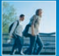
Bildung und Kultur